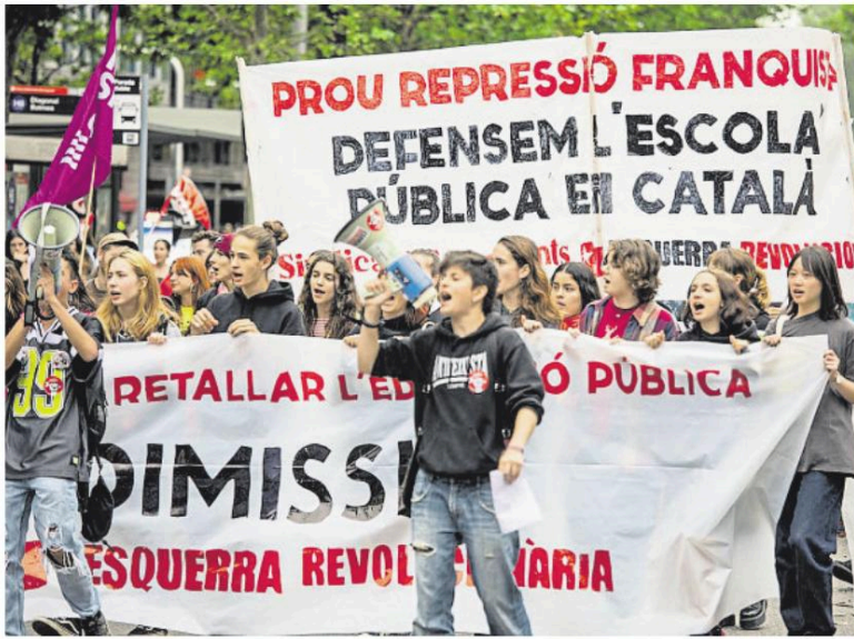
Manifestació a favor de l'ensenyament en català a l'escola pública